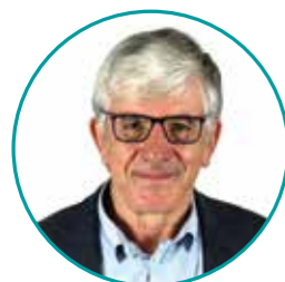
PRÉSIDENT Bernard Uthurry

En juin 2020, un nouveau Conseil communautaire a été élu. Il est composé de 74 représentants. Voici les élu.e.s du Bureau et leurs attributions.