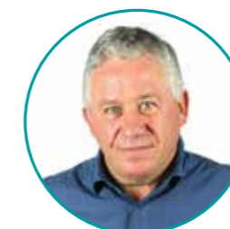
VICE-PRÉSIDENT Henri Bellegarde

Petite enfance Éducation Temps périscolaire et extrascolaire Restauration scolaire