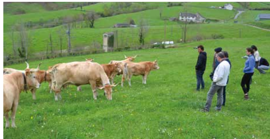
*LEADER : programme européen visant à soutenir les territoires ruraux.