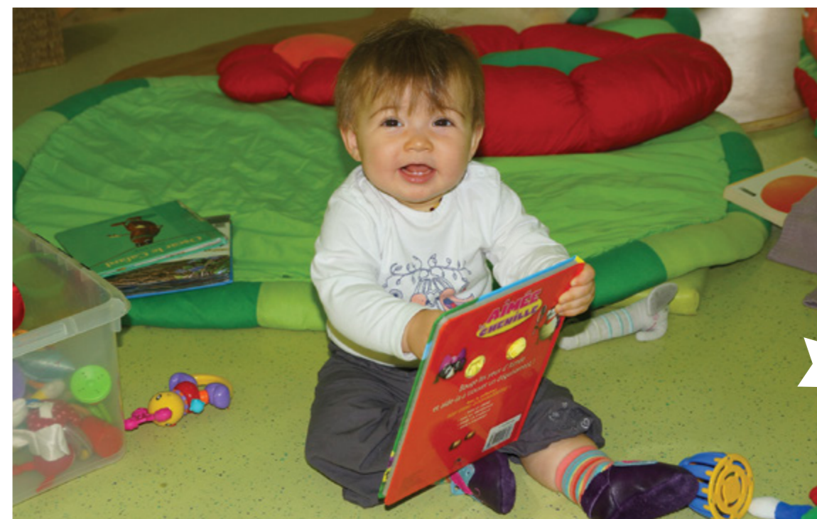
Journée nationale des Assistantes Maternelles Samedi 23 novembre 2013