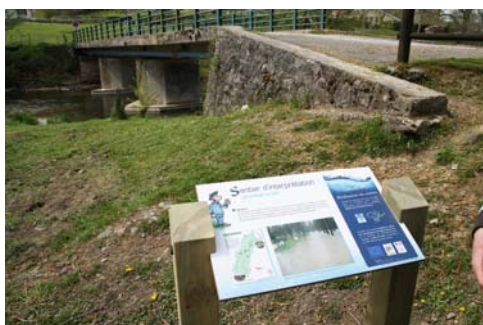
Deux panneaux sont placés près du Pont noir, et les deux autres sont à l'autre bout du parcours santé.